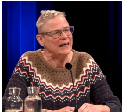
Kerk en Israël Noord- Holland