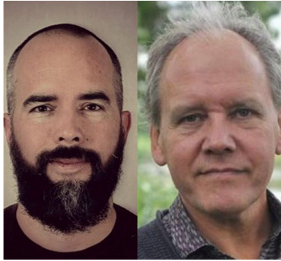
Kerk en Israël Overijssel-Flevoland